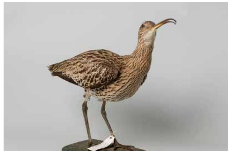
Regenwulp, ca. 1965, VU Expositium-263.