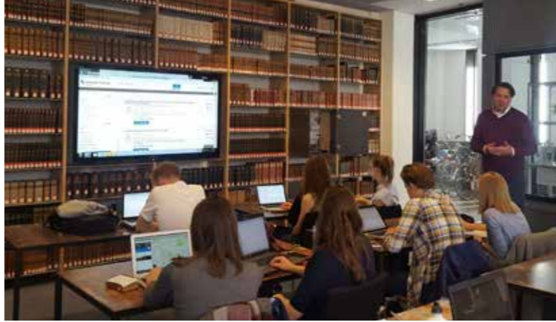
Foto: Romaine (CC) via Wikimedia Commons, sessie van de Historical Book Review.