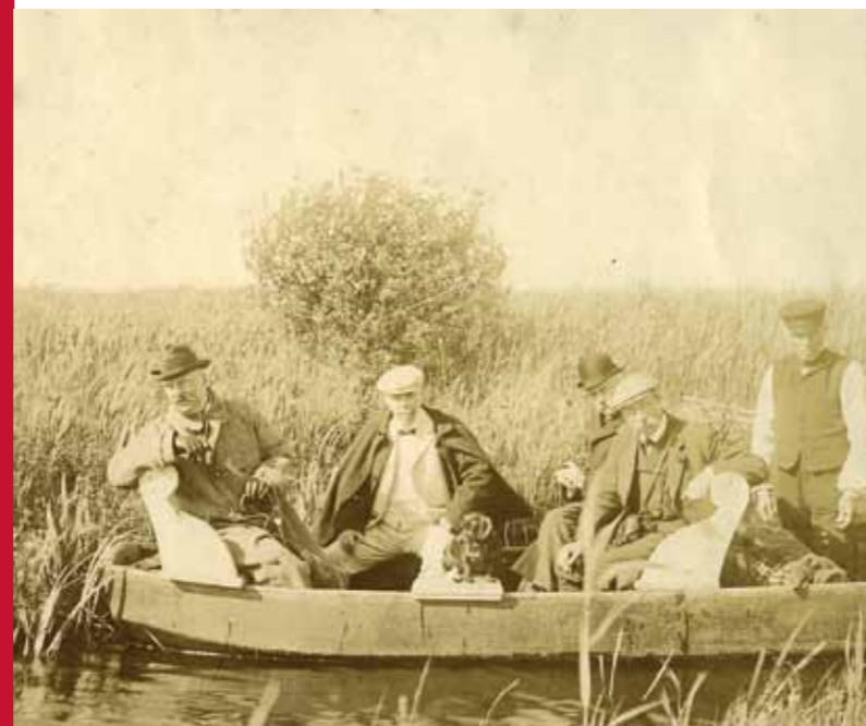
Bezoek van prins Hendrik (links) aan het Noordermeer, 1909. Vierde van links: Jac. P. Thijsse.