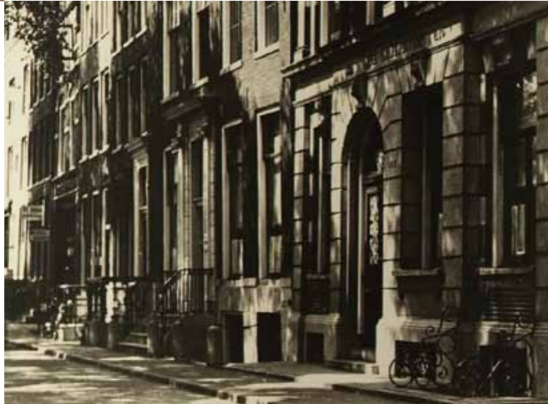
Keizersgracht 162, Universiteitsgebouw van de VU van 1883 tot 1966