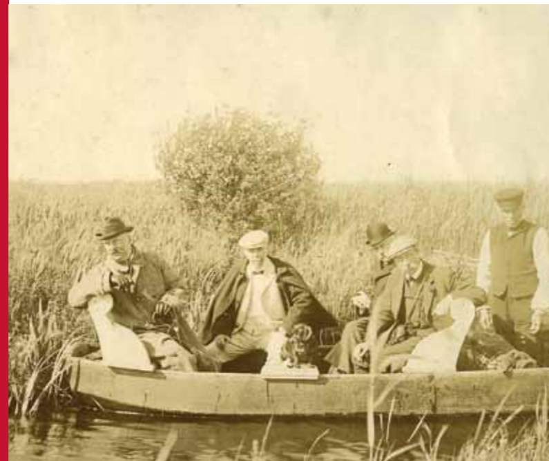
Bezoek van prins Hendrik (links) aan het Noordermeer, 1909. Vierde van links: Jac. P. Thijsse.

Heimans en Thijsse: twee namen die al ruim een eeuw onlosmakelijk met elkaar verbonden zijn. Jacob Heimans (1861-1914) en Jac. P. Thijsse (1865-1945) waren eind negentiende eeuw allebei onderwijzer in Amsterdam en liefhebbers van de Nederlandse natuur. Om hun liefde over te brengen op de jeugd schreven ze een reeks boekjes en startten zij het (nog altijd bestaande) tijdschrift De Levende Natuur . Duizenden maakten zij zo enthousiast voor 'de natuursport'. Heimans bleef door zijn vroege dood enigszins onbekend bij het grote publiek; Thijsse werd een nationale beroemdheid vanwege zijn Verkade-albums. De archieven van Heimans en Thijsse zijn onlangs door de afdeling Bijzondere Collecties van de Universiteitsbibliotheek Amsterdam verworven, samen met materiaal van honderden personen en organisaties die in hun voetspoor traden.