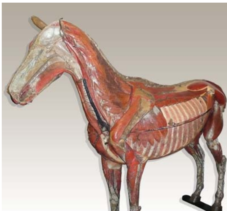
Paard van Auzoux, collectie Wageningen UR